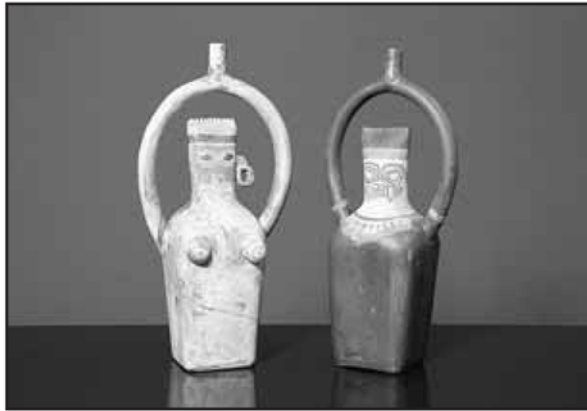
Récipients en terre cuite, brazilien ancien. MRV

Le Musée romain de Lausanne-Vidy présente de soi-disant trouvailles découvertes par des scientifiques lausannois au cœur de la jungle amazonienne. Les vestiges des Brazuliens, une civilisation fictive, pourront être admirés jusqu'au 25 avril 2011.