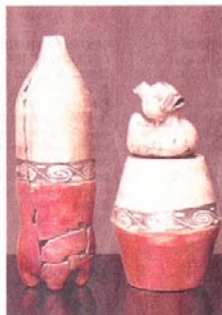
Flacon et récipient en terre cuite tels qu'ils furent produits au brazulien moyen, soit au VIe siècle de notre ère... MRV