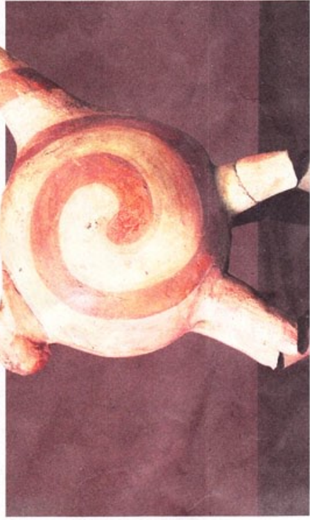
Récipient zoomorphe en terre cuite, brazulien ancien.