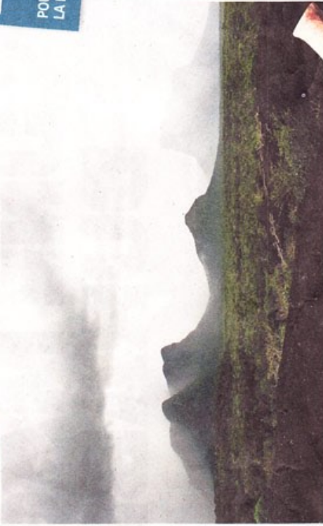
Le massif de la Neblina.