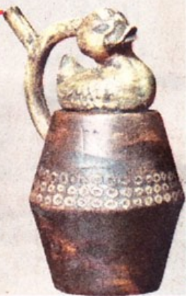
MUSÉE ROMAIN, LAUSANNE