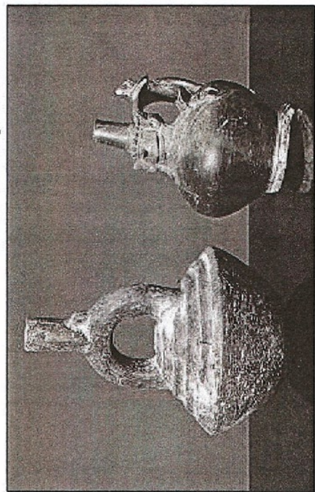
Récipients en terre cuite, brazulien ancien (II e siècle av. - VI e siècle ap. J.-C.). LDD

La civilisation brazulienne s'est développée sur une dizaine de siècles, pour s'éteindre