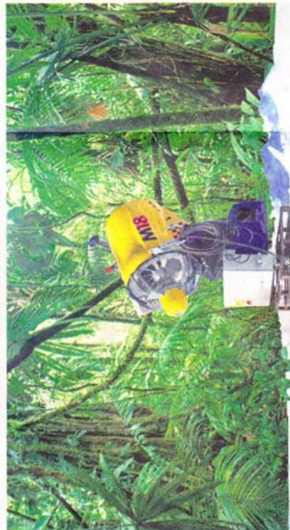
Les fouilles ont exigé l'usage d'appareils hypersophisticqués.