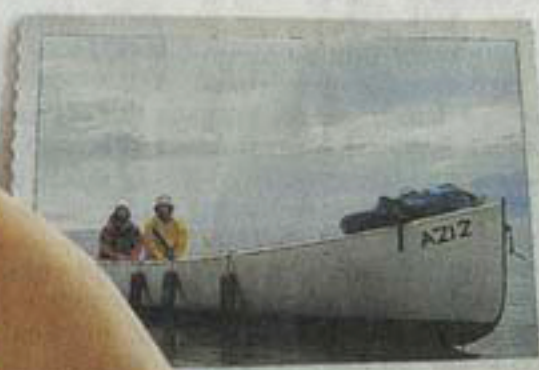
Quand Eugène nous mène en bateau!