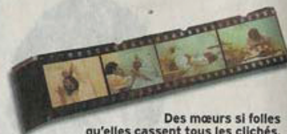
Des mœurs si folles qu'elles cassent tous les clichés.