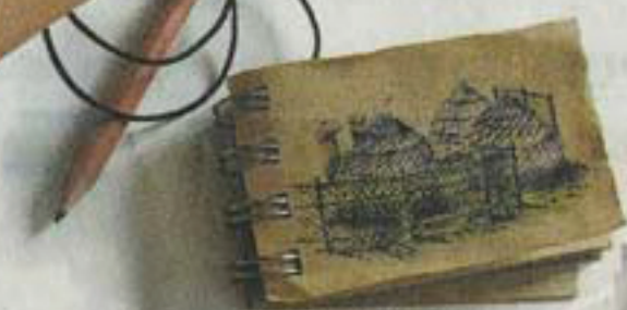
Le carnet de voyage, un accessoire indispensable.